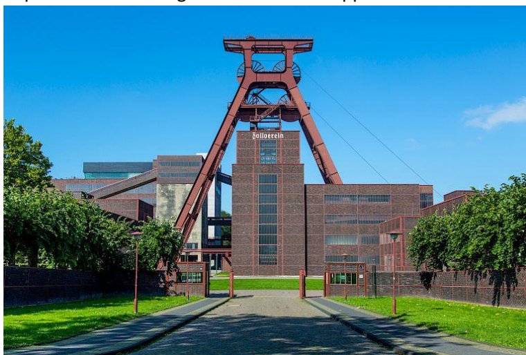
IBA Emscher Park, The Zollverein Mine gateway, 2013

Au cœur de chaque IBA se trouvent plusieurs projets concrets. Ces projets doivent être fédérés autour d'une idée, le Motto . La recherche de cette idée fédératrice est l'objet de la phase de préfiguration, qui détermine la stratégie et pose les bases d'une IBA . La stratégie, les valeurs, les enjeux et les principes communs sont tous à inventer ; c'est pourquoi la préfiguration est propice à un dialogue ouvert et transparent, créatif et expérimental.