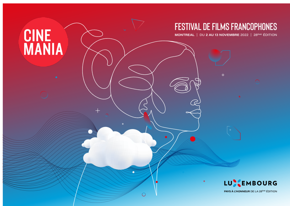
Visuel commun, réalisé par charlee (Charles Nilles)

Il s'agit, d'une part, de la réalisation d'un visuel commun (ci-dessous) à disposition des parties prenantes, du montage d'une vidéo commune qui sera diffusée lors de chaque séance du festival ainsi que d'un lettrage complété d'une animation informative digitale qui permettra aux résidents et visiteurs de Montréal de découvrir plus en profondeur le pays (exemples : L comme Lëtzebuergesch, U comme Unique, X comme X-tra, E comme Europe etc) sur la Place des Festivals, centrale et très fréquentée, de Montréal.