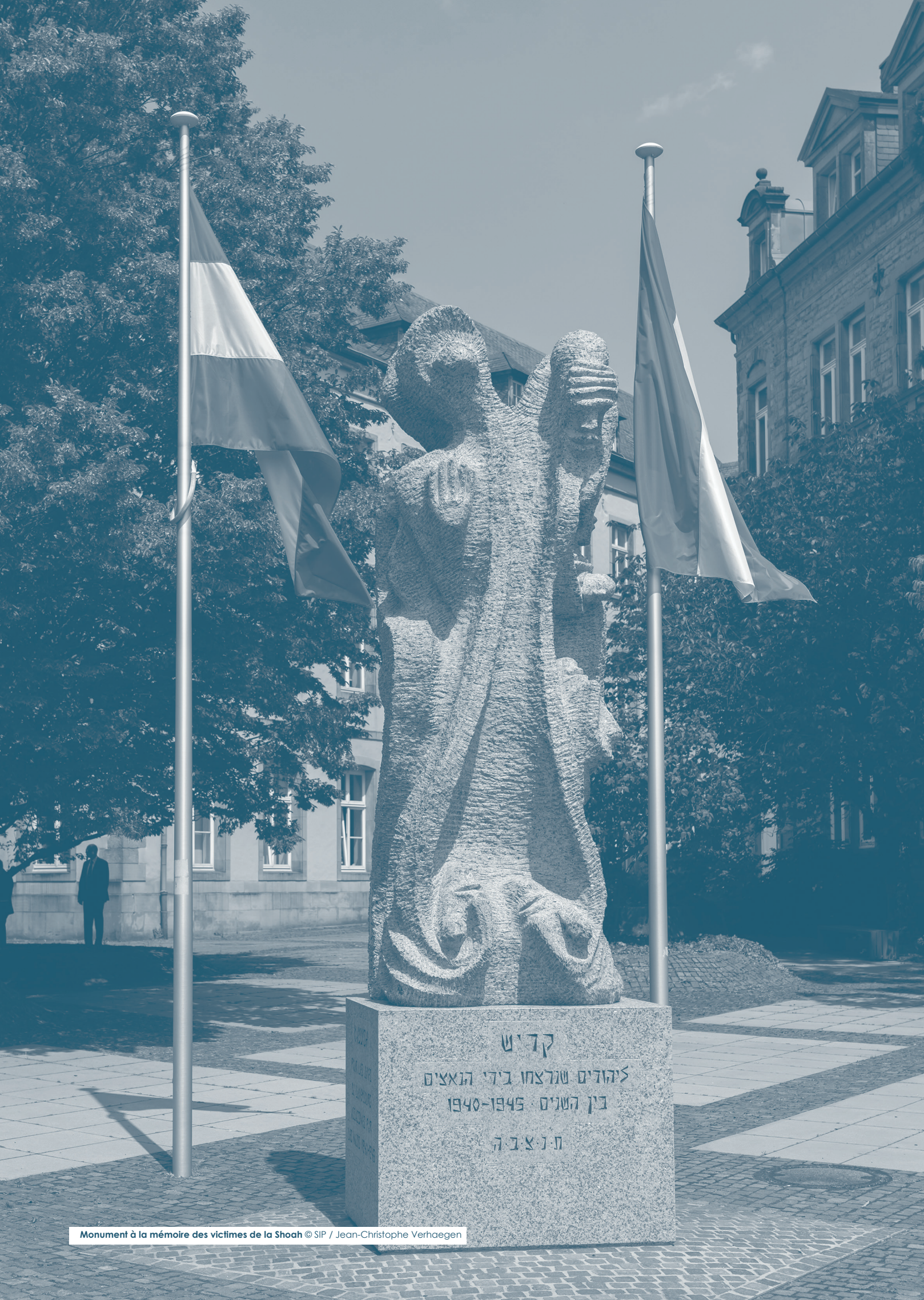
Monument à la mémoire des victimes de la Shoah