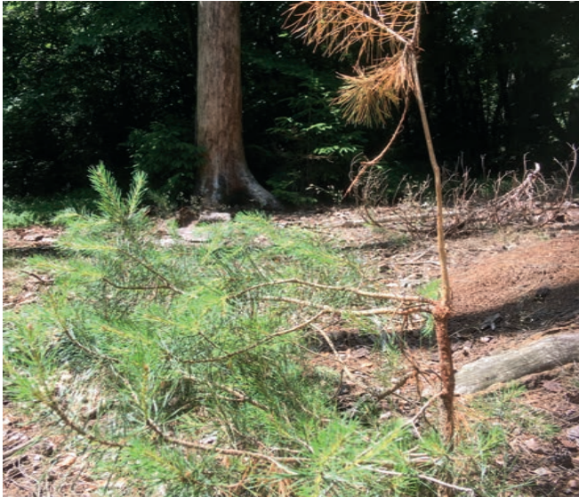
Fegeschäden an Waldkiefer durch Rehbock