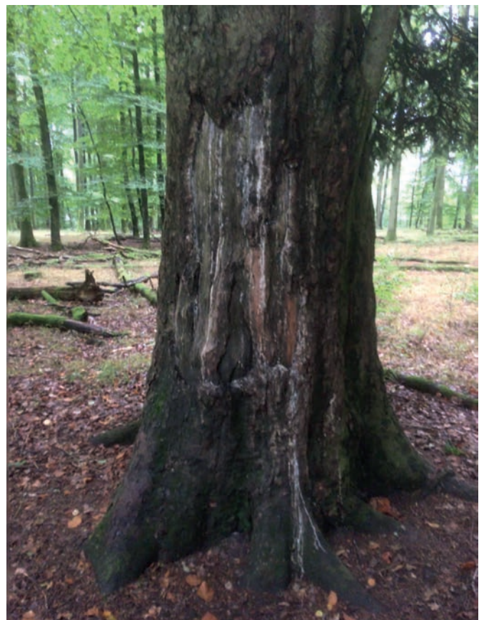
Massive Schäden von Rothirsch an Douglasie (Rouscht 2019)