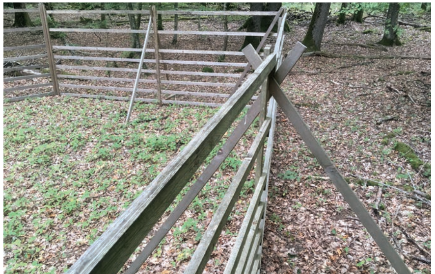
Mittels Weisergatter lässt sich der Druck des Schalenwildes auf die Naturverjüngung veranschaulichen (Weisergatter in einem Stieleichen-Hainbuchen Bestand, Friemholz bei Echternach, 2019)

Diese Fakten sollten auch mit den im Folgenden genannten wissenschaftlichen Instrumenten vermittelt werden.