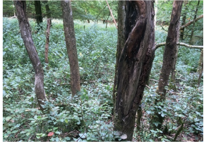
Schälwunden an Eschen durch Rothirsch (Rouscht 2018)

Zusammengefasst: zu viel Wild frisst gerade jene Jungbäume bzw. Eichen und Buchecker auf, die dringend ältere absterbende Bestände ersetzen sollten.