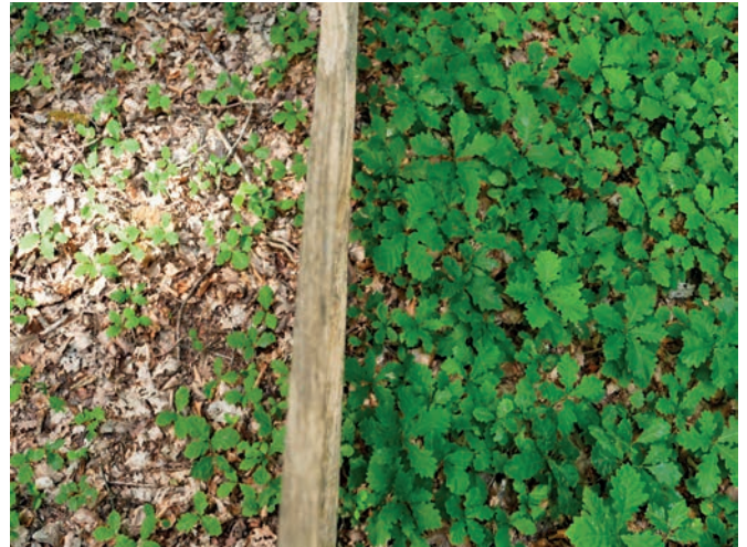
Das Fehlen jeglicher Jungeichen außerhalb des Gatters zeigt den hohen Wildbestand. Wieviel dem Frassdruck der Wildschweine auf die Eicheln beziehungsweise der Rehe auf die Jungeichen geschuldet ist, lässt sich hier nicht erkennen. Detailaufnahme innerhalb (links) und außerhalb (rechts) des Gatters

Die zahlreichen Wildschweine ihrerseits lieben Eicheln und Buchecker, sodass auch die Fortpflanzung von Bäumen auf diesem Wege aufgrund zu hoher Wildschweinebestände, nur noch sehr begrenzt erfolgen kann.