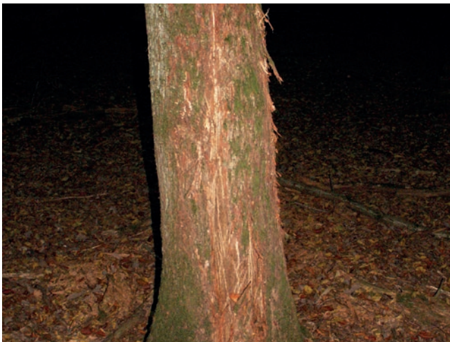
Reviermarkierung durch Hirsch(stier)

Eine gezielte Reduzierung der Schalenwildbestände ist aus Natur-, Umwelt- und Klimaschutzüberlegungen sowie aus Sicht des Tierschutzes demnach dringend notwendig, um die Naturverjüngung sowie Neupflanzungen und somit die Zukunft unserer Wälder zu erhalten.