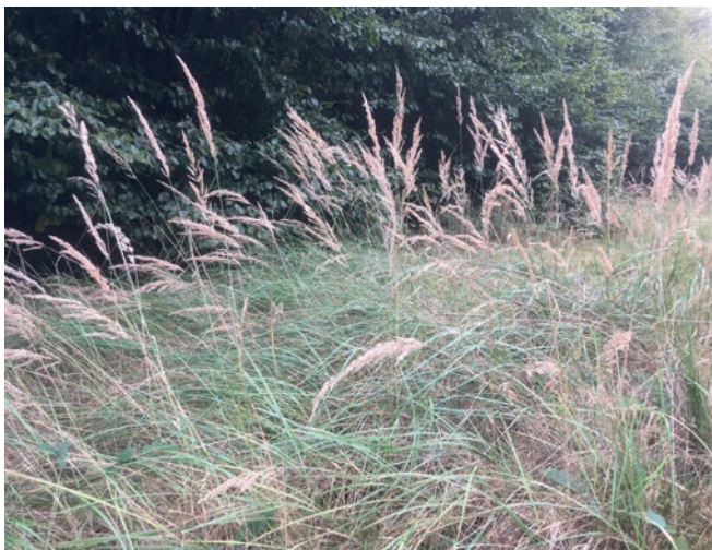
Die rauen Blätter des Waldreitgrases werden von Reh und Hirsch verschmät, so dass sich diese Art besonders auf den tonigen Keuperböden durchsetzt und der dichte Wurzelfilz eine spätere Naturverjüngung gefährdet (Waldreitgras, 2019)