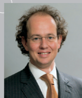
Luc Frieden Ministre du Trésor et du Budget

« L'engagement du Luxembourg pour la microfinance en matière de coopération au développement ne s'arrêtera pas au 31 décembre 2005. Nous envisageons d'ores et déjà des actions concrètes en phase avec les idées qui émergeront au cours de cette année. Dans ce contexte, le Gouvernement et le secteur privé devront travailler de concert afin d'aborder un des défis les plus ambitieux que la communauté internationale a choisi de relever, à savoir la réalisation des Objectifs du Millénaire pour le Développement. La Microfinance offre la possibilité d'encourager ce partenariat public/privé ».