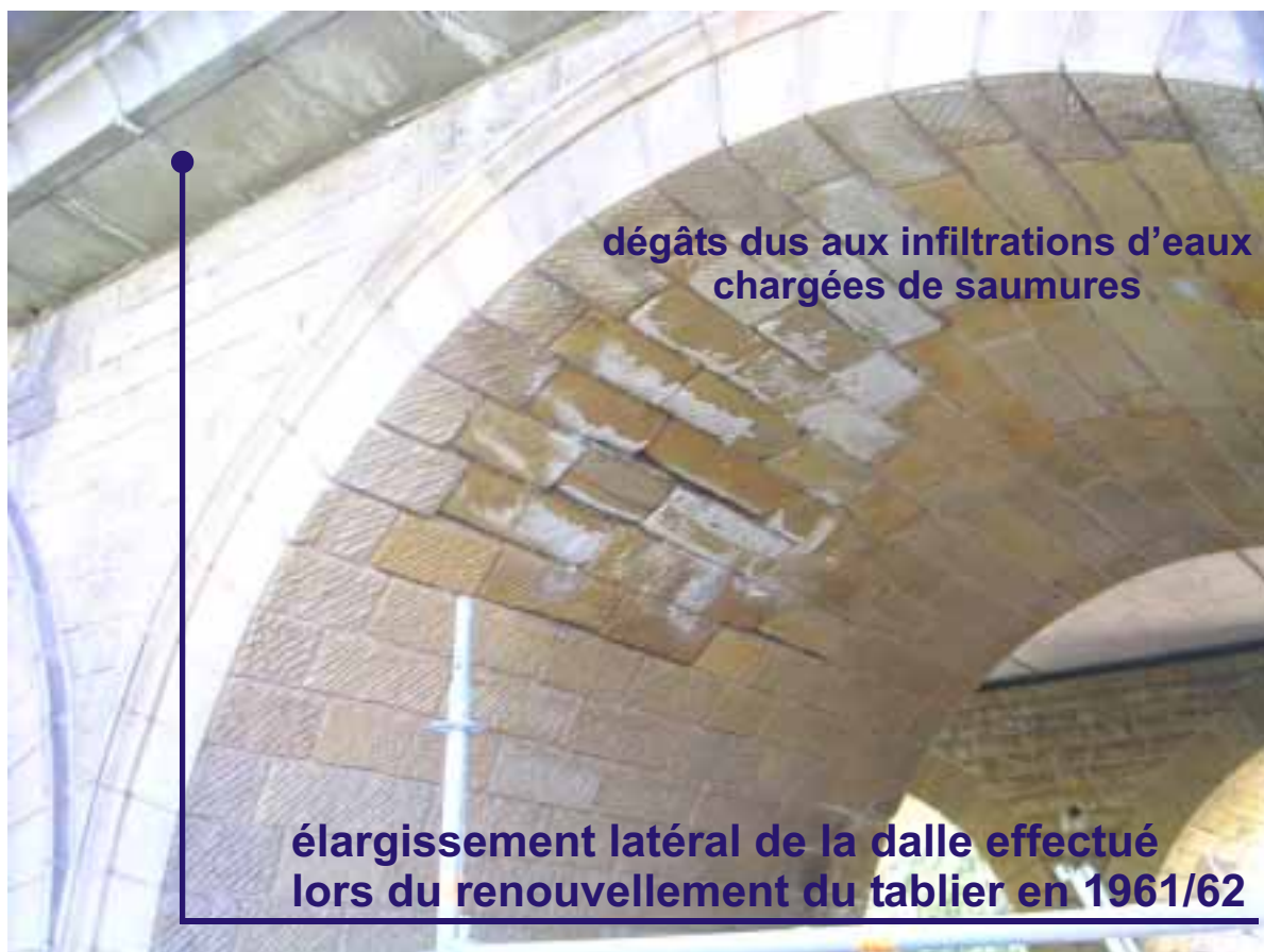
Dégâts à la maçonnerie dus aux infiltrations d'eau