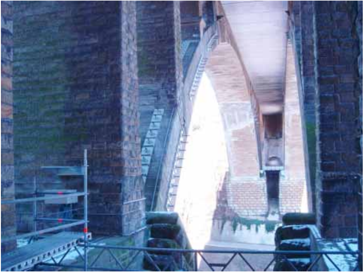
Mesures de stabilisation provisoires