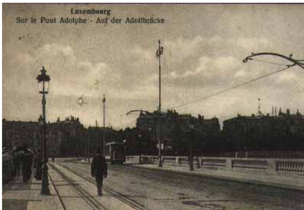
Cartes postales montrant le pont fini