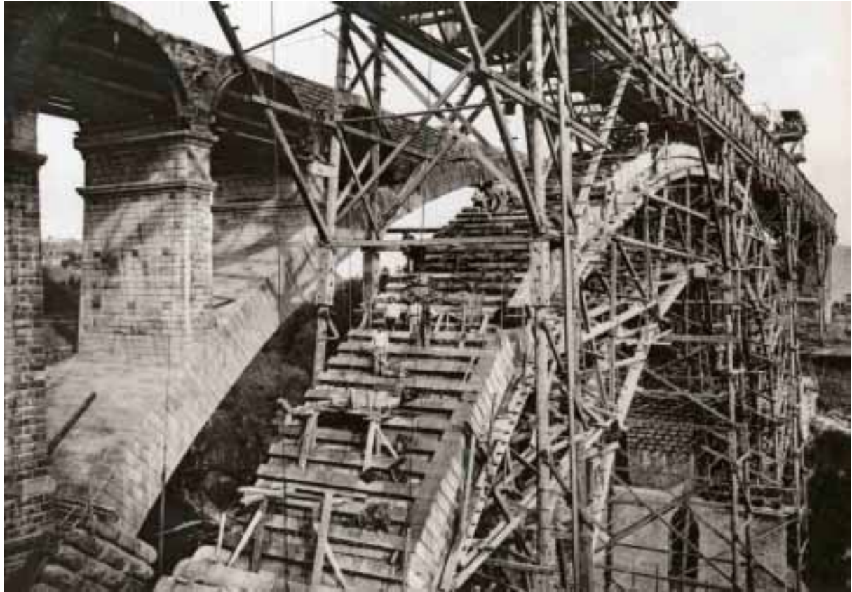
La construction du pont Adolphe