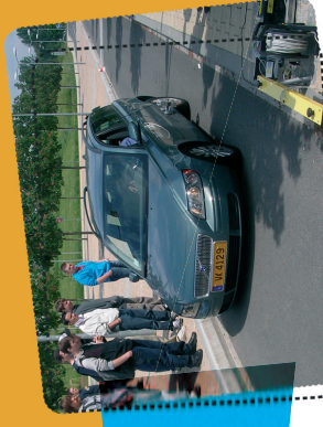
Test de freinage