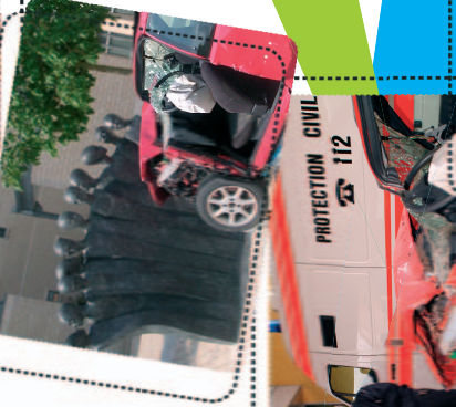
Analyse des dégâts