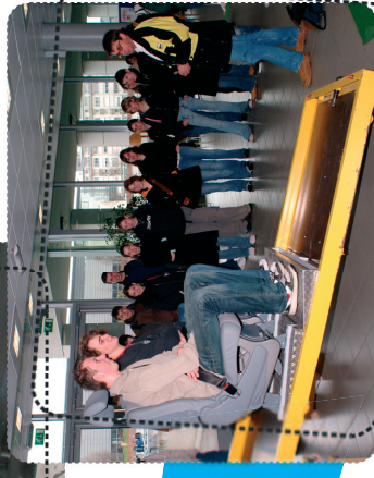
Test sécurité ceinture