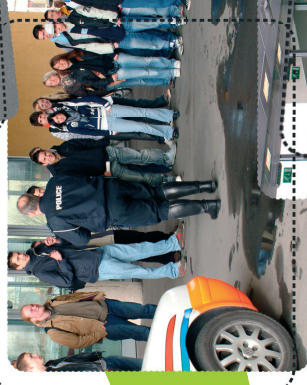
Droits et obligations sur la route