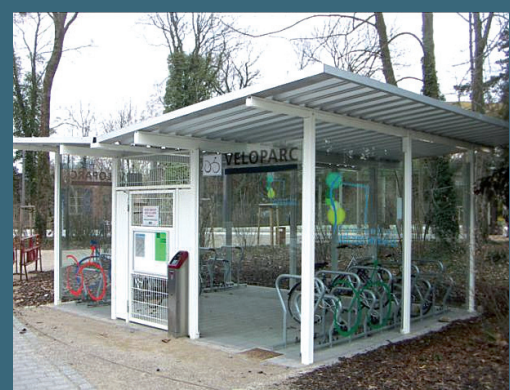
Verbesserung der Ausstattung der Haltestellen im Tal

Die hier vorgestellten Maßnahmen können alle in der ersten Phase des Mobilitätskonzepts (bis 2014) umgesetzt werden. Mittelfristig (2. Phase) und langfristig (3. Phase) umzusetzende Maßnahmen, wobei hier auch die zukünftige Entwicklung im Alzettetal wie zum Beispiel die geplante Bebauung rund um den Bahnhof Mersch verstärkt berücksichtigen sollen, sind noch in Ausarbeitung.