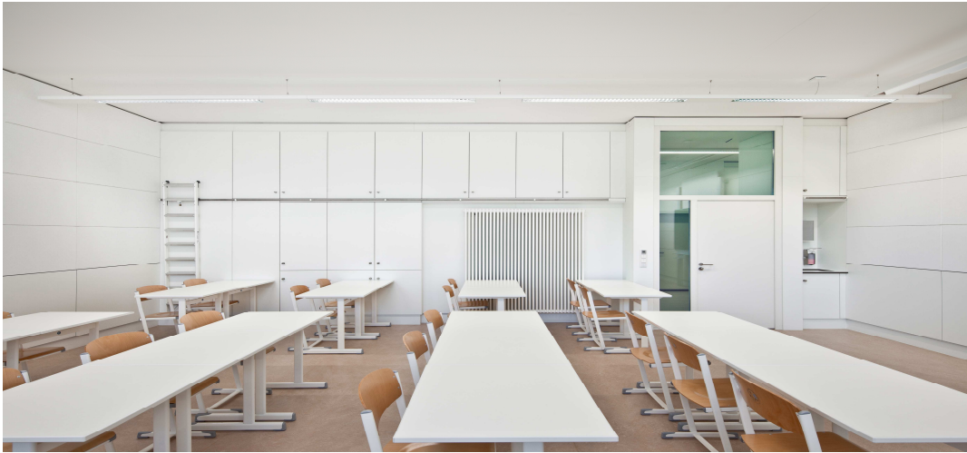
Salle de lecture et d'étude