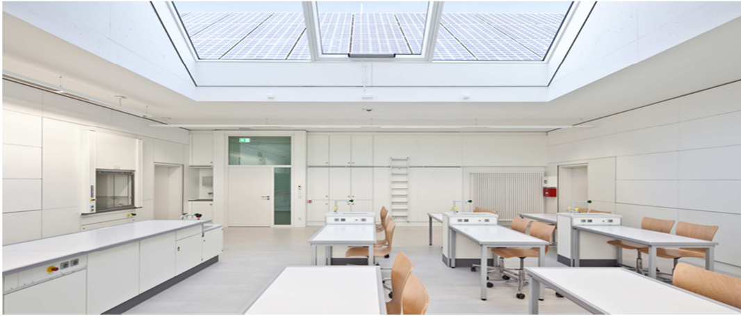
Salle de classe traditionnelle