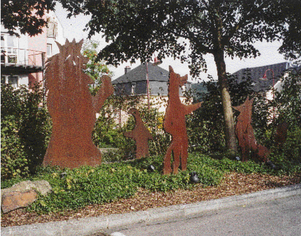
Place Michel Rodange zu Steesel Skulpturen: Schüler vum Lycée technique des Arts et Métiers ennert der Leedung vum Marcel Tockert)

Deckelsait: Portrait vum Michel Rodange: Frantz Seimetz Postkaart: Monument Rénert um Knuedler: François Mersch: La Belle Epoque Zeechnungen aus dem Buch: Editions J.- P. Krippeler-Muller, Luxembourg, 1980 Illustratiounen: Éischte an zéngte Gesank: Pit Weyer