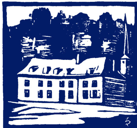
Stierhaus vum Michel Rodange a Clausen