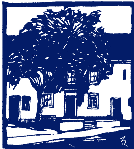
Gebuertshaus vum Michel Rodange zu Waldbëlleg