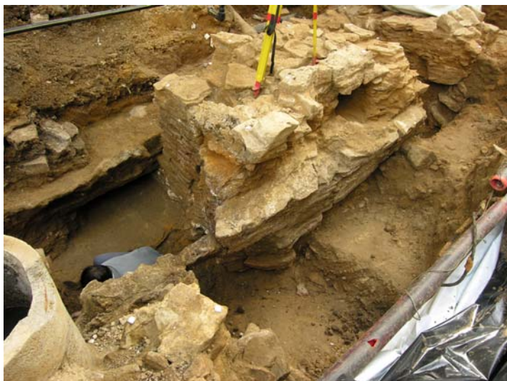
3) Le bâtiment A avec sa cave supérieure. A l'arrière-fond un mur se prolonge vers la librairie Fellner, montrant que la rue de l'Eau était à l'origine beaucoup plus étroite qu'aujourd'hui.