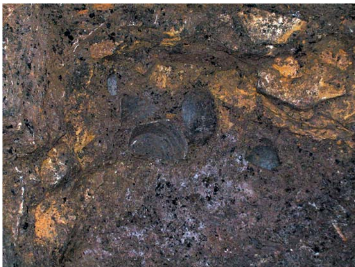
4) Céramique du 13 e /14 e siècle trouvée à côté de la structure B.