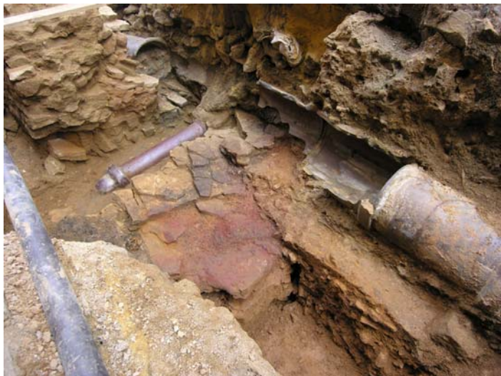
2) Le début du fossé et le rocher brûlé sur lequel reposait le mur d'enceinte. La photo montre bien les difficultés techniques rencontrées lors de la fouille.