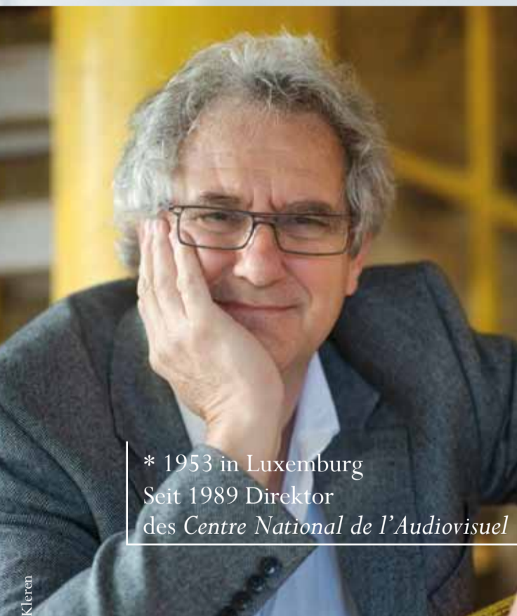
* 1953 in Luxemburg Seit 1989 Direktor des Centre National de l'Audiovisuel

Literaturpreis der Europäischen Union 2010