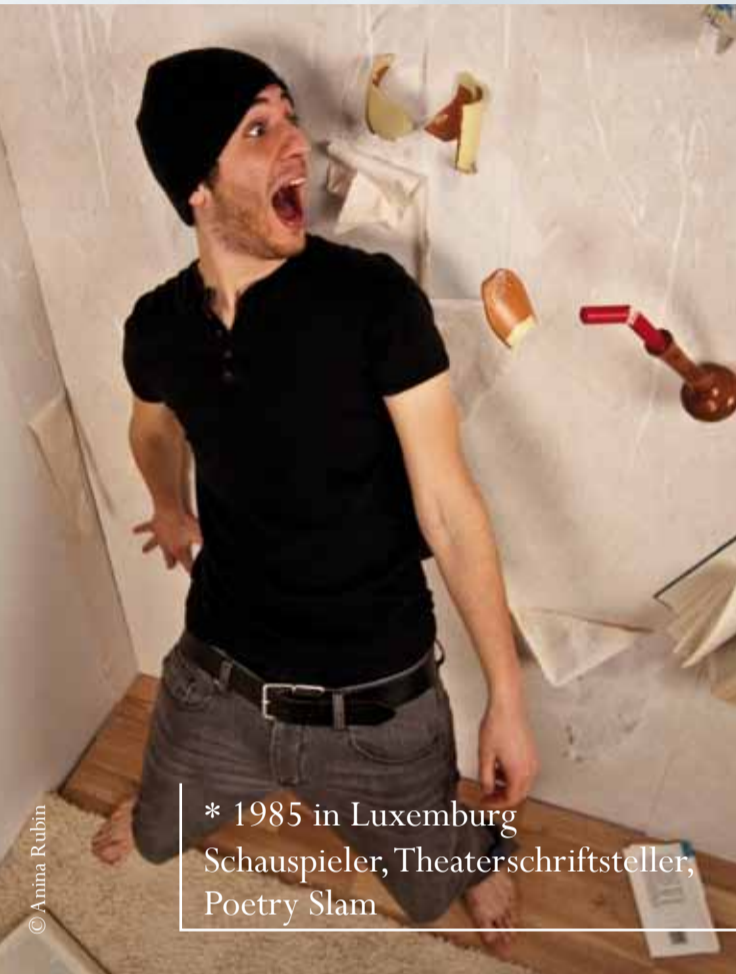
* 1985 in Luxemburg Schauspieler, Theaterschriftsteller, Poetry Slam

Historische Fiktion Rebellion der 68'er Generation in Luxemburg