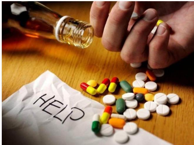
TABLE RONDE “ADDICTIONS” DU 1ER JUILLET 2014