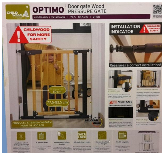
OPTIMO réf. VHO0, EAN 5420007123529 OPTIMO White réf. VHOOW, EAN 5420007132439