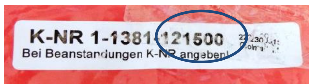
« Schwenk Türschutzgitter », réf. 2732, lot 121500

Tous les produits non-conformes ont fait l'objet de mesures d'interdictions de vente, de retraits et de rappels par l'ILNAS. Certaines de ces barrières étaient encore commercialisées en décembre 2016 au Luxembourg. Etant donné le risque grave pour la santé et la sécurité, les produits concernés ont également été notifiés à la Commission européenne par le biais du système communautaire d'échange rapide d'informations (RAPEX). Cette notification permet aux autres Etats membres de l'Union européenne de prendre les mesures nécessaires pour interdire la mise sur le marché de ces produits sur leur territoire national.