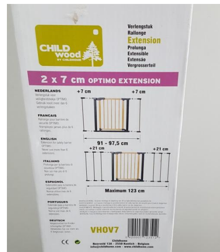
Extension réf. VHOV7, EAN 5420007123512