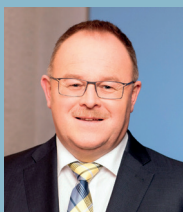
Romain Schneider Ministre de la Coopération et de l'Action humanitaire

La Coopération luxembourgeoise a créé la Business Partnership Facility pour soutenir cette nouvelle dynamique et renforcer le rôle du secteur privé dans la mise en place d'une croissance inclusive dans les pays en développement. Créons ensemble des partenariats innovants, bénéfiques à la fois pour nos entreprises et celles des pays en développement.