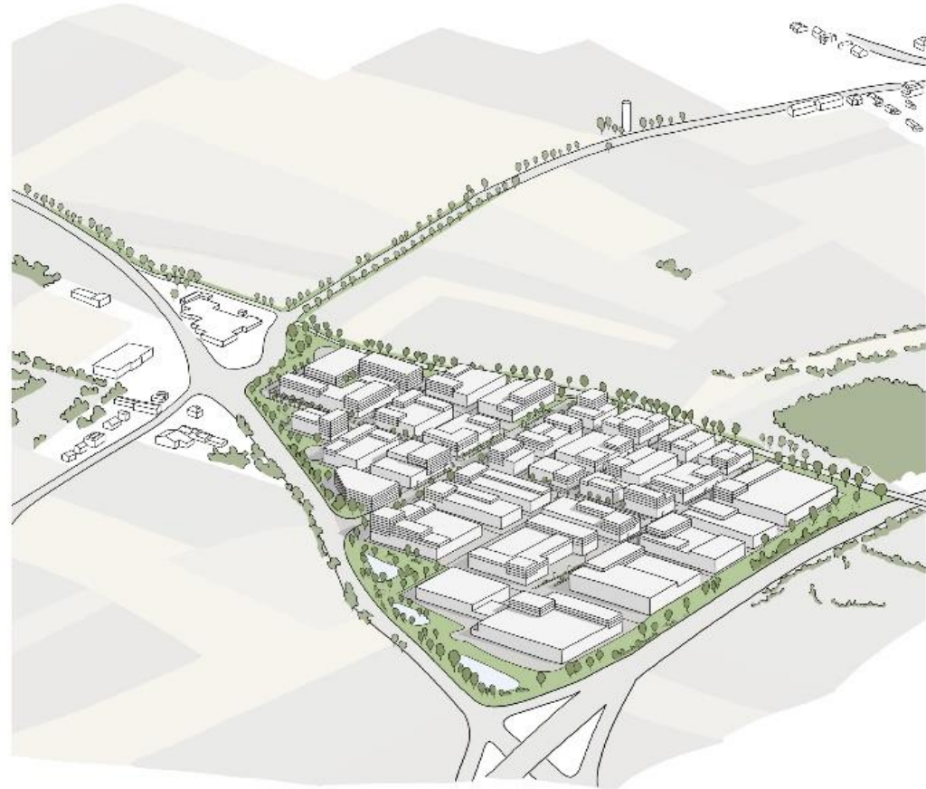
Axonométrie du projet de densification de la zone d'activités économiques Triangle Vert existante