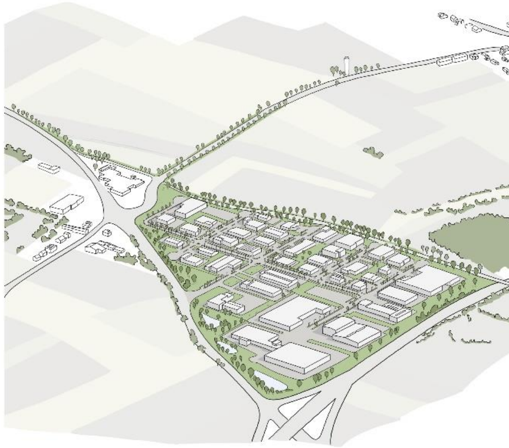
Axonométrie de la zone d'activités économiques Triangle Vert existante