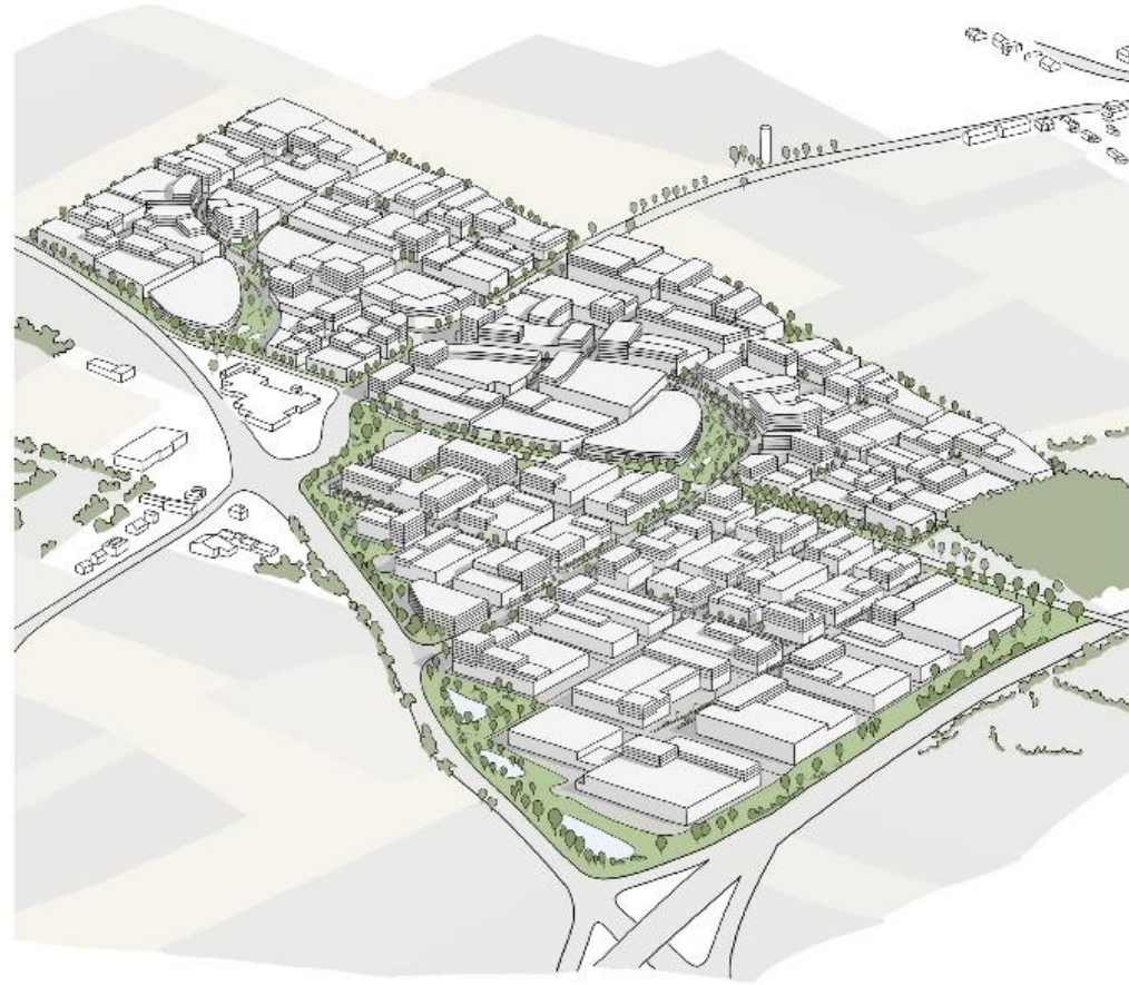
Axonométrie du projet de densification de la zone d'activités économiques Triangle Vert