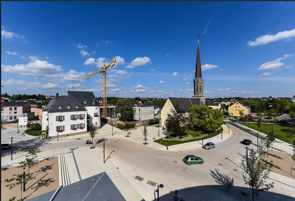
Shared space Bertrange

Une commune peut promouvoir une mobilité durable et inclusive en développant des transports accessibles à tous, en favorisant les modes doux et en réduisant la dépendance à la voiture.