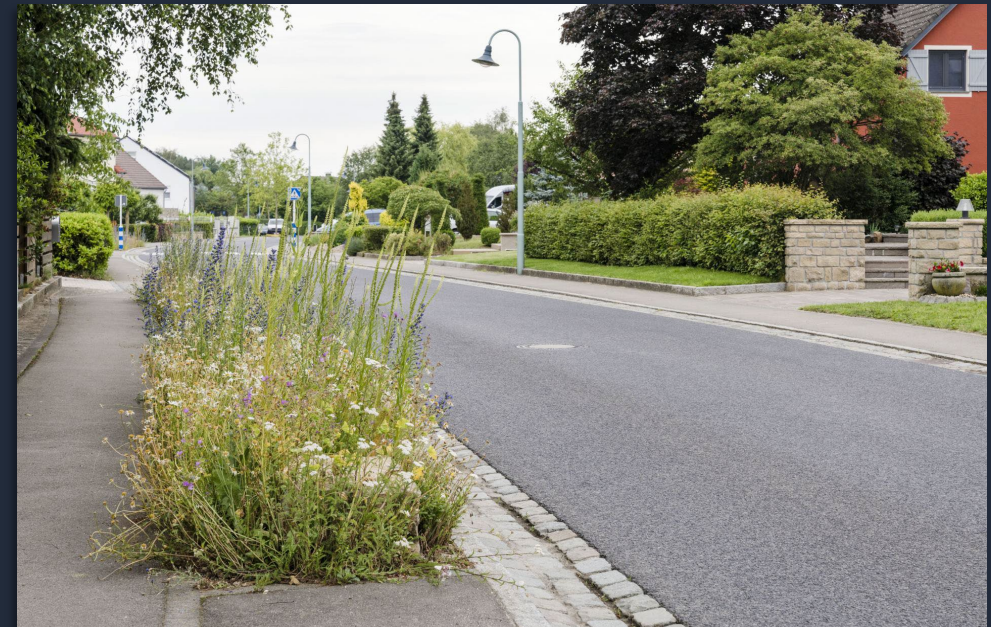
Naturno Opwärtung zu Konsdref