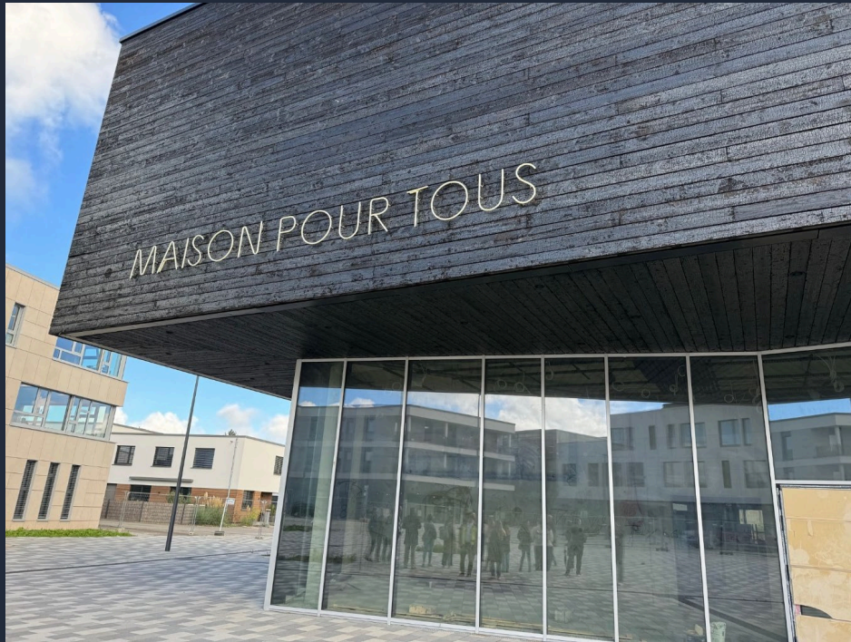
“Maison pour tous”, Quartier Elmen, Kehlen