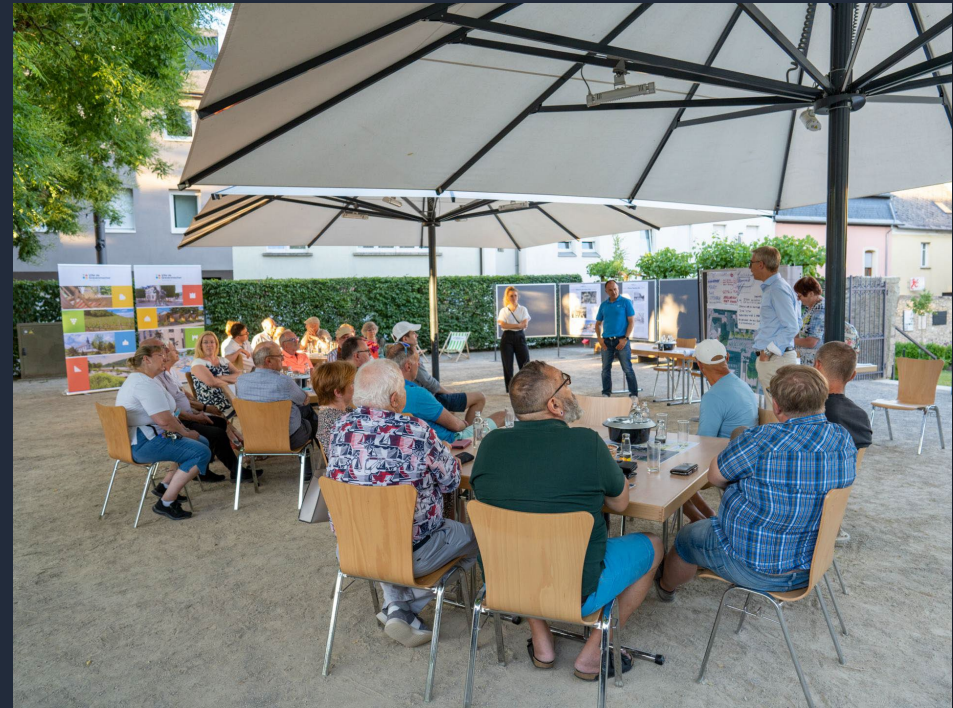
Participation citoyenne - Place du Marché à Grevenmacher